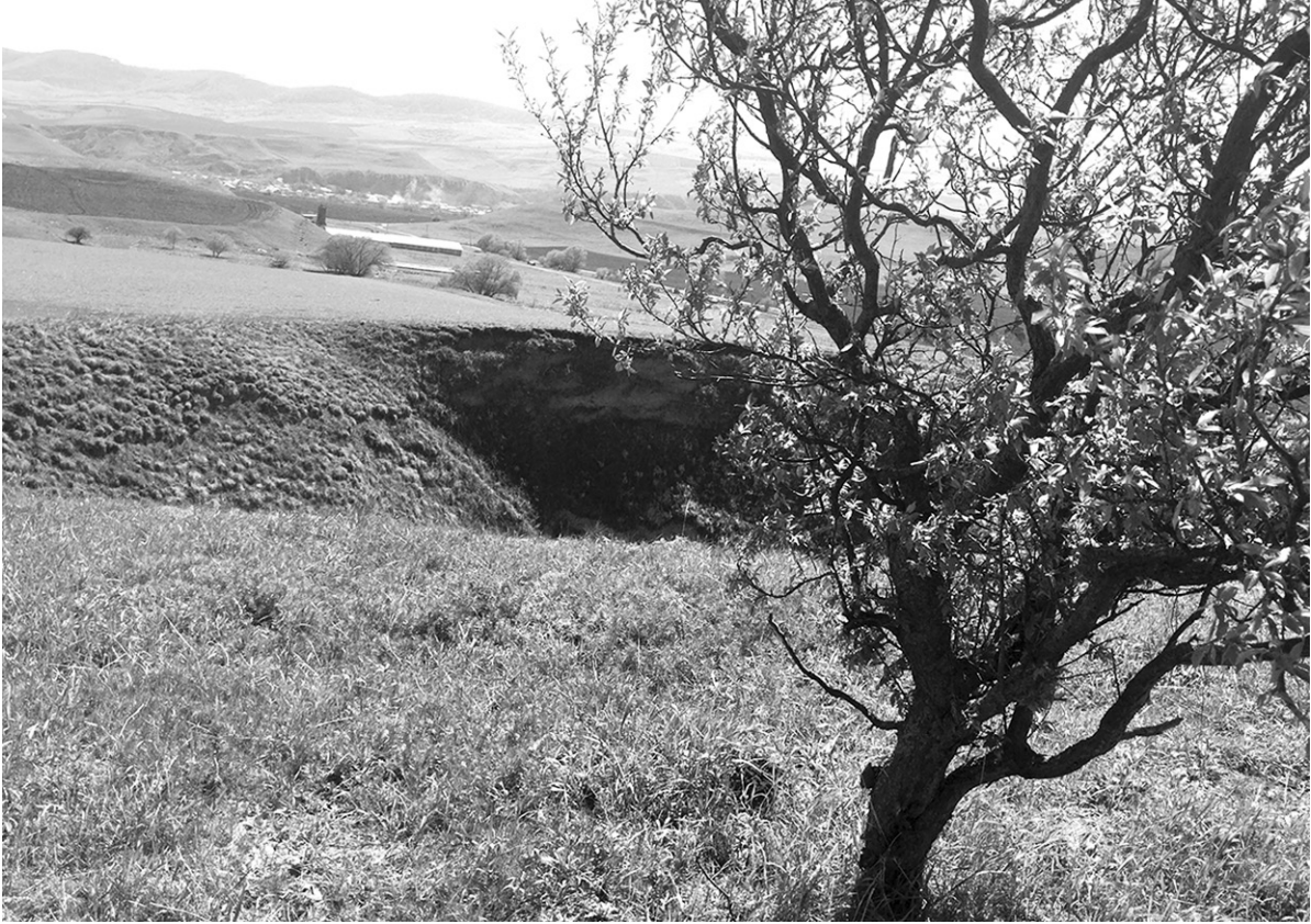
Так выглядит карстовый провал в районе аула Хабез

Началось всё в середине прошлого века, когда, как вспоминают старожилы аула, им показалось, что снова началась война. На рассвете, в пять часов утра, над аулом раздался грохот, и поднялось облако серой пыли. Когда испуганные жители осознали, что аул на месте, никто не погиб, а облако пыли осело на взгорье в двух километрах от аула, самые смелые двинулись туда, да так и замерли с открытыми ртами.