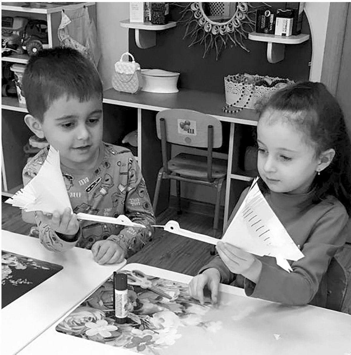
Воспитанники «Теремка» с удовольствием мастерят разные поделки

В детский сад «Теремок» ходят более 100 малышей. С ними занимаются настоящие профессионалы — 13 воспитателей высшей и первой категории.