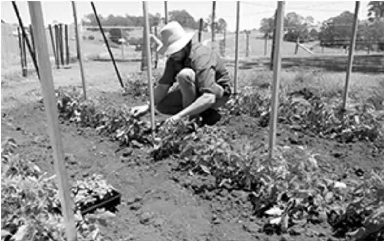
Место для грядки должно быть открытым и хорошо освещенным

Песчаная почва хорошо известна тем, что не удерживает влагу